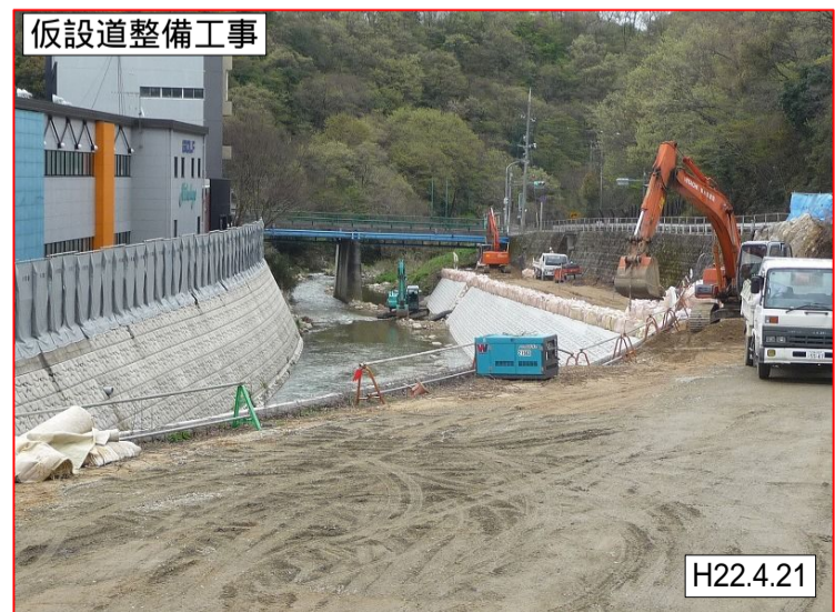
此原工区 焼山松ヶ丘2丁目付近