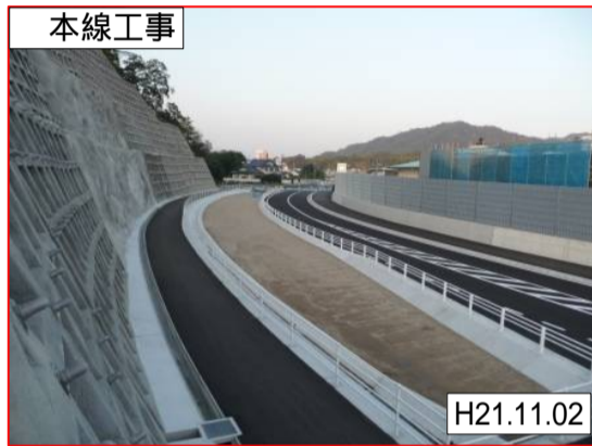
呉環状線交差点北側