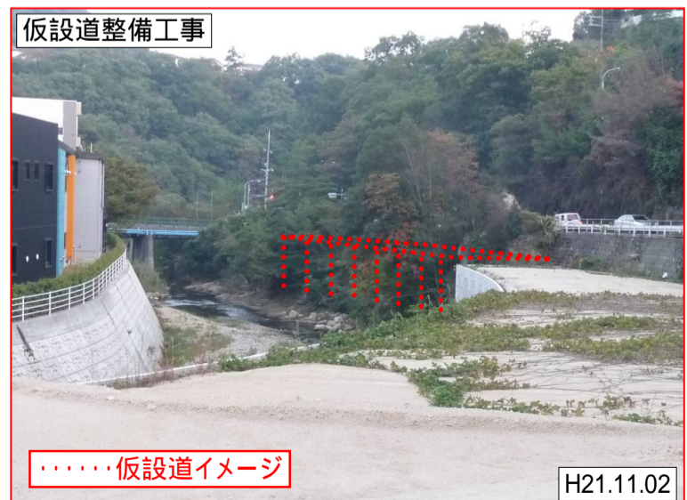
此原工区 焼山松ヶ丘2丁目付近