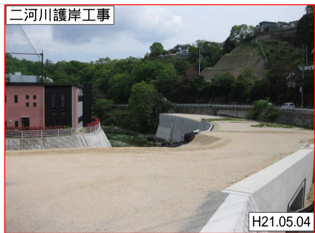
此原工区 焼山松ヶ丘2丁目付近