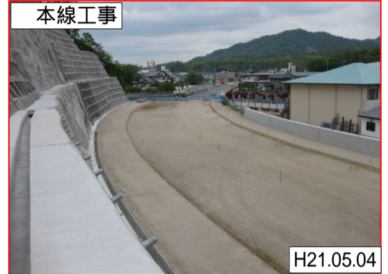
呉環状線交差点北側