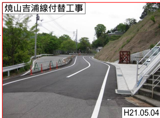
此原工区 焼山ひばりヶ丘町付近